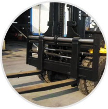
Posicionador Hidráulico De La Horquilla (opcional)