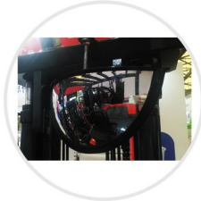
Amplio Espejo Retrovisor