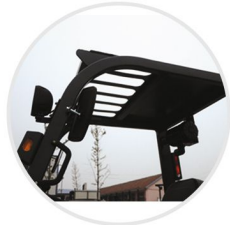
Fuerte Protector Superior